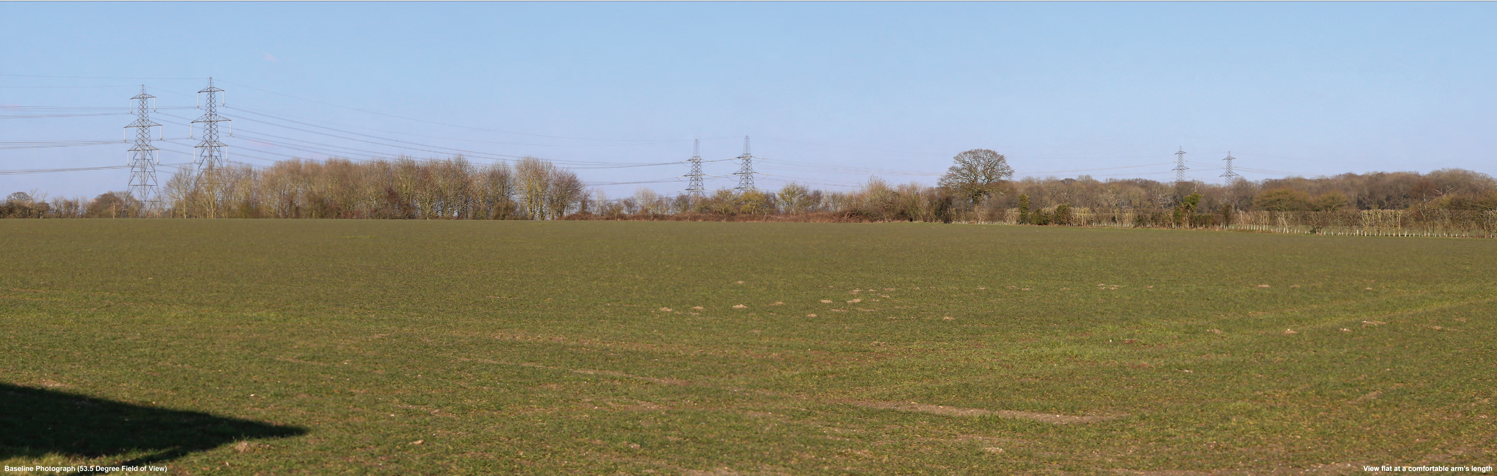
Baseline Photograph (53.5 Degree Field of View)