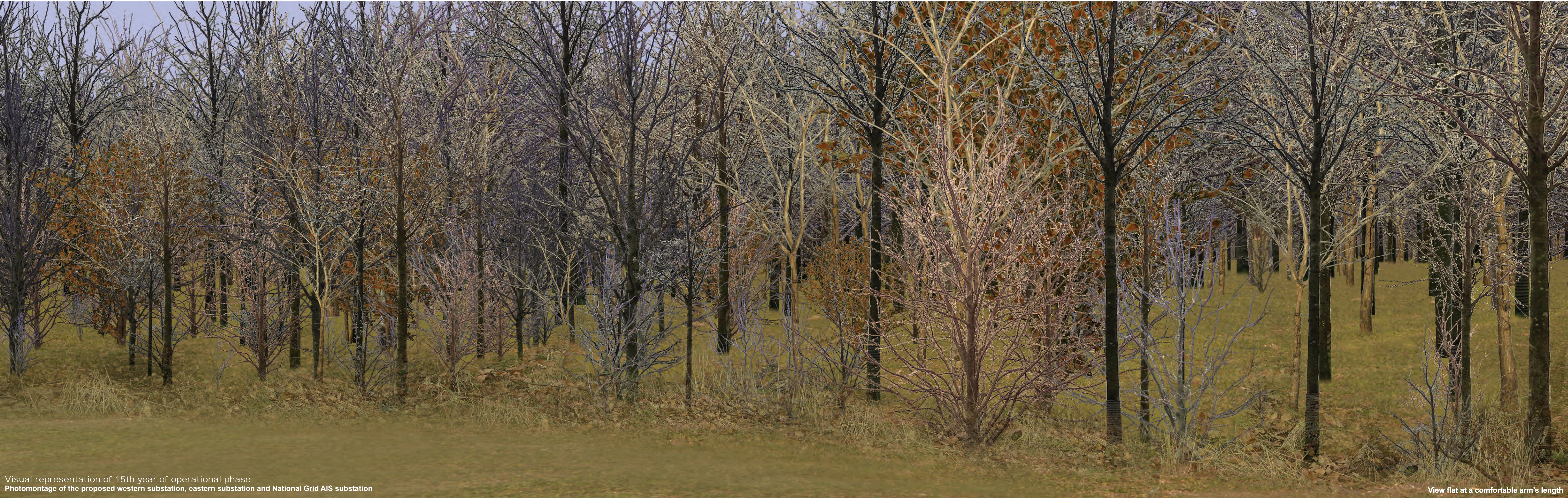
Visual representation of 15th year of operational phase Photomontage of the proposed western substation, eastern substation and National Grid AIS substation