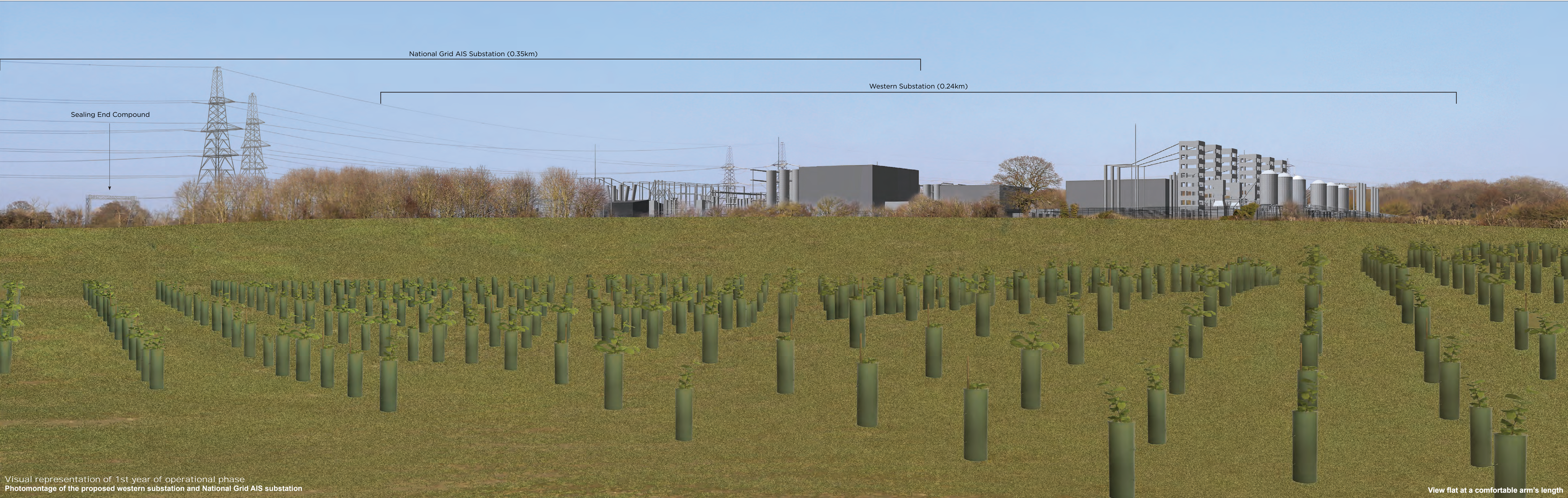
Visual representation of 1st year of operational phase Photomontage of the proposed western substation and National Grid AIS substation